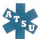
TABLEAU DE GARDE SECTEUR 4 - GUEBWILLER - ENSISHEIM AOÛT 2020